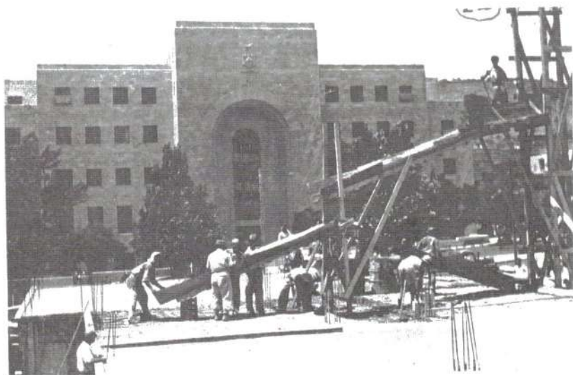
איור 4: היכל עיריית חיפה שנחנך ב-1942.